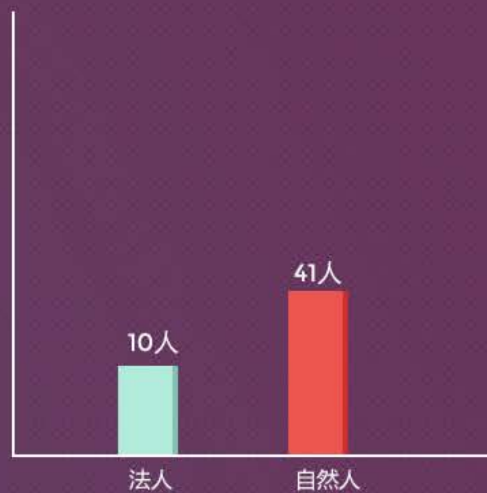
自然人&法人本月借款人数分布