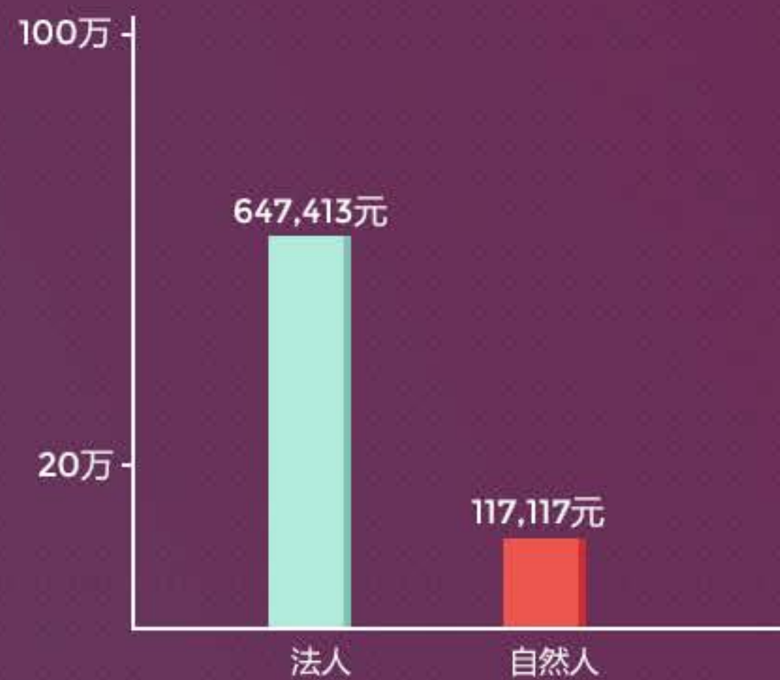
自然人&法人人均借款金额分布