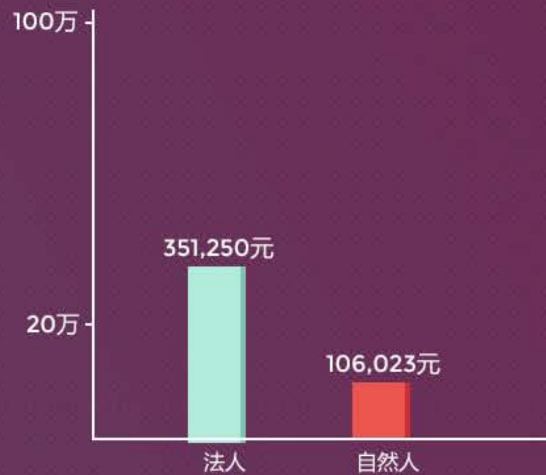
自然人&法人人均借款金额分布