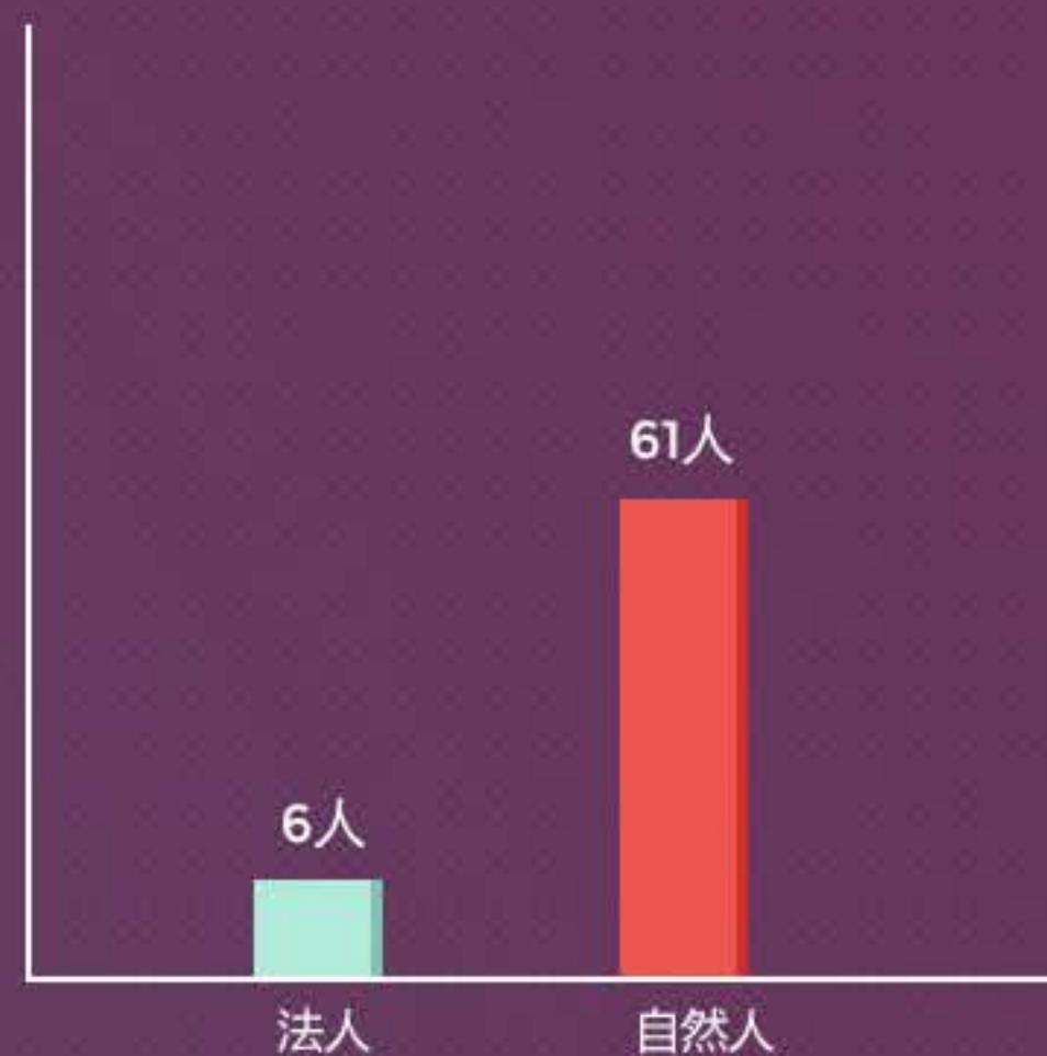
自然人&法人本月借款人数分布