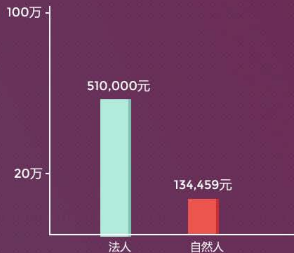
自然人&法人人均借款金额分布