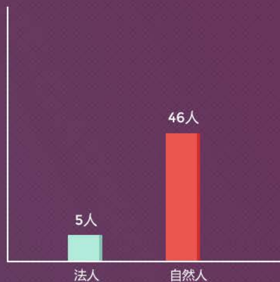
自然人&法人本月借款人数分布