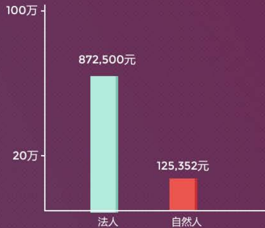
自然人&法人人均借款金额分布