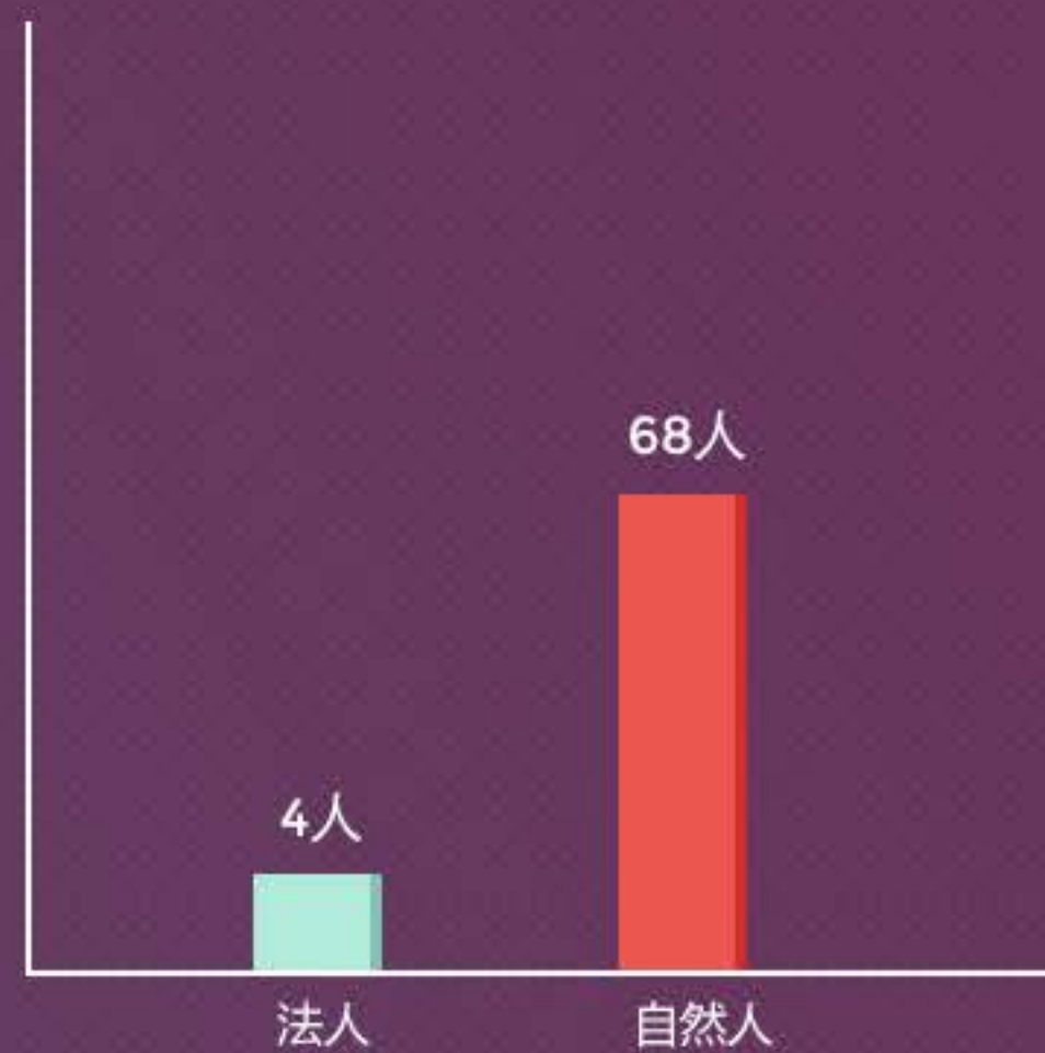
自然人&法人本月借款人数分布