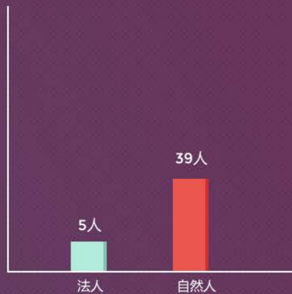
自然人&法人本月借款人数分布