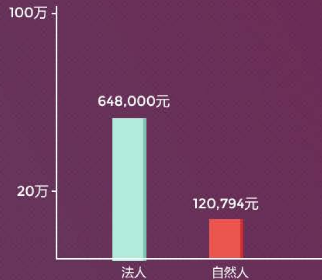
自然人&法人人均借款金额分布