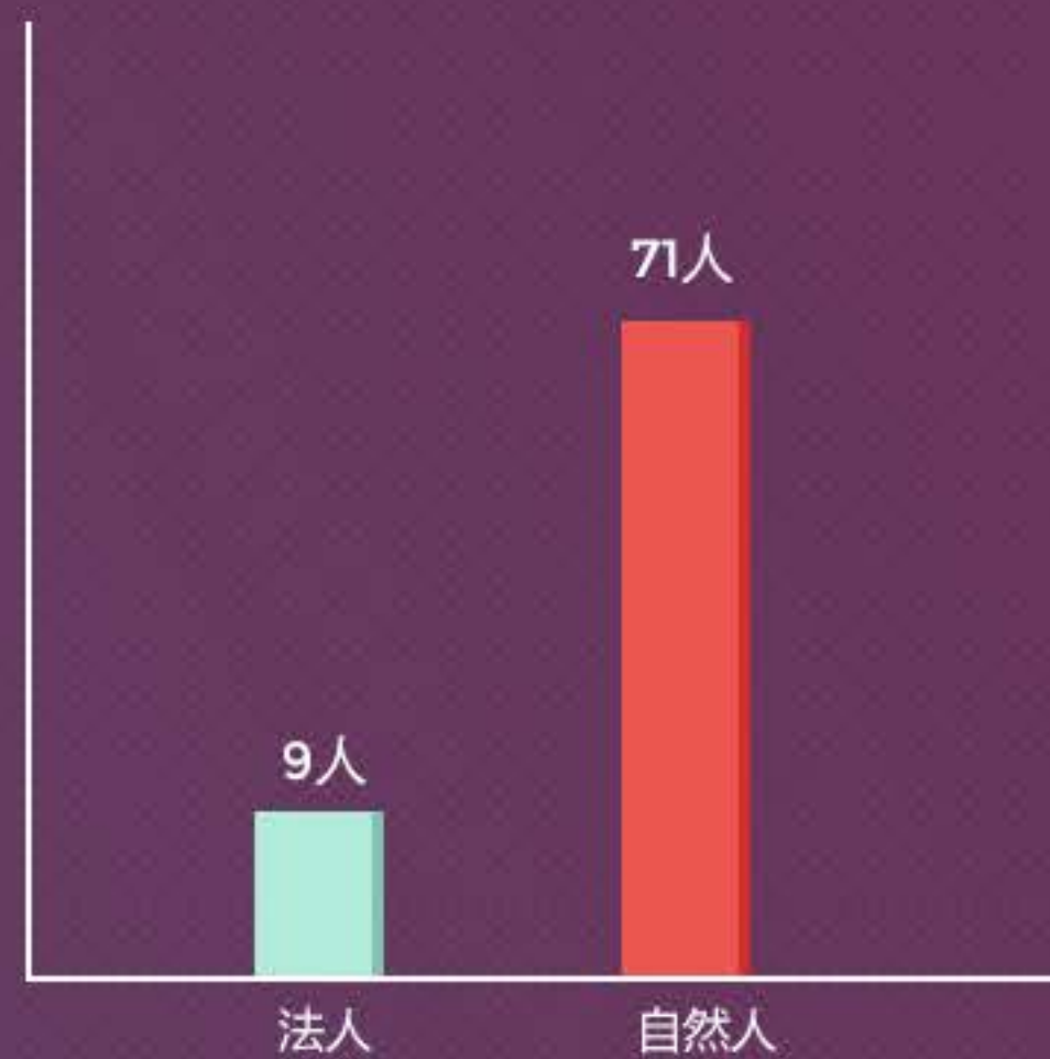
自然人&法人本月借款人数分布